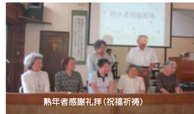
熟年者感謝礼拝(祝福祈禱)