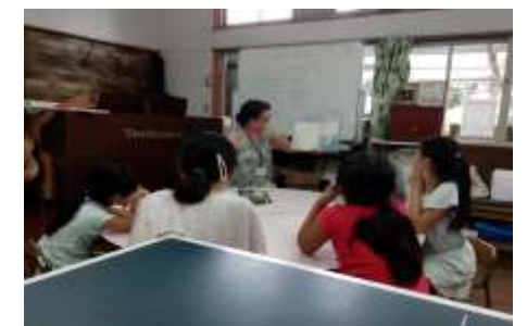
8/24(土)子どもと大人の絵本の読書会 「がらがらどん」テーマ:へいわとせんそう