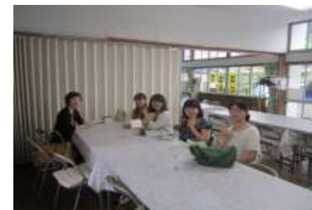
8/25(日)教会学校 ユース(中・高校生)