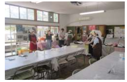
11/3 (土)バザー開始前ミーティング