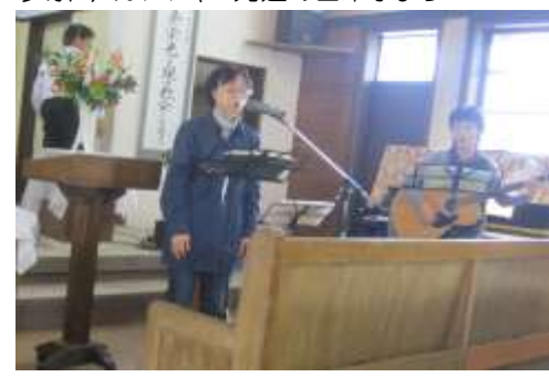
礼拝前、賛美のひと時