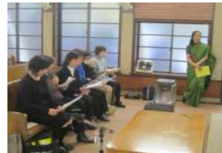
派遣宣教師、各地の紹介 祈りと献金のお願ひ(女性の会)