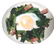
絵本にでてきた 山鳩の巣→